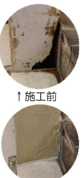
↑ 施工前 ↑ 施工後