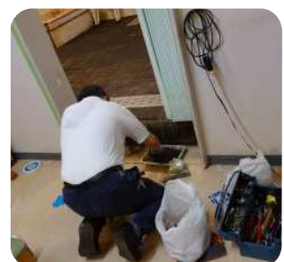
老朽化して穴が開いていた浴室入口の柱をセメントで補修しペンキも塗り直してリニューアル！