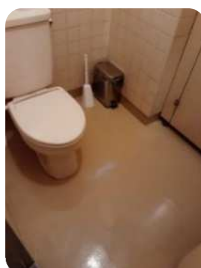
塗装がはがれていた一階のトイレの床にペンキを塗ってピカピカに！

「ホテルでの経験があったこと、そして様々な機器を修理することが好きだったことを活かし、誰かの役に立つ用務的な仕事をしたいと思って応募しました。」という言葉通り、細かいところによく気が付き、自発的にどんどん環境改善を進めてくれています。なんでもこなす器用さに脱帽です！