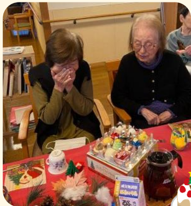
可愛いクリスマスケーキ を前に大感激!!