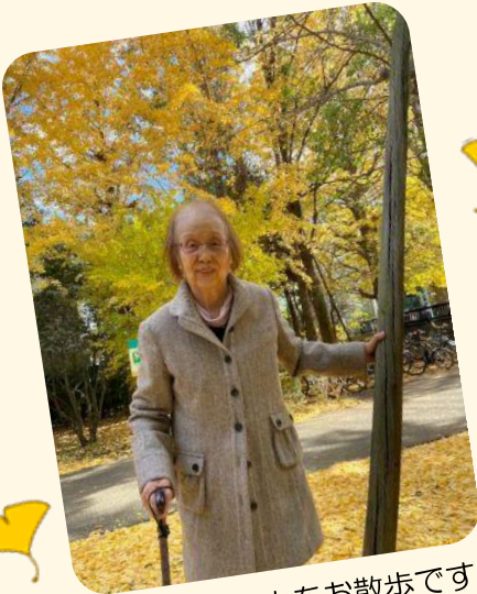
鮮やかな銀杏の中をお散歩です