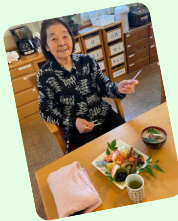
おせちとお雑煮 いただきま〜す!