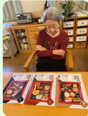
どれがいいかしら…

ご利用者様、皆さんお元気に令和7年元旦を迎えられました。明るい年明けです。元旦の昼食は、みなでおせち料理と雑煮を頂きました。おせち料理は年末にカタログを見て皆さんに選んでもらって購入しました。届いたお料理をお皿にきれいに盛りつけて頂きました。雑煮は丸餅を茹でて白味噌仕立ての京風です。美味しくできました。今年も、美味しい物をたくさん食べて楽しい年にしましょう!