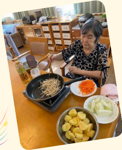
料理の腕をふるいます