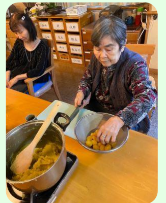
栗きんとんは手作りです