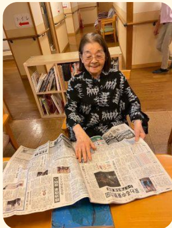
今日も新聞、届いています!