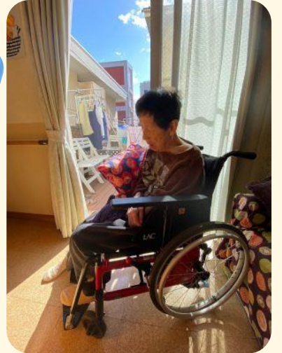
日向ぼっこでいい気持ち♡