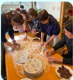
みんなで丸めてあんこを包んで…

ご家族様には、あんこを丸め、大根を下ろして味付けをして頂き、豚汁も味付けして頂きました。ご利用者様みんなで餅を丸め、あんを包みました。曾孫さんも餅をついたり、あんこを包んだり活躍して頂きました。ご家族様のおかげで伸びの良い美味しい餅がつきあがり、あんこ餅 きな粉餅 ごま餅 大根おろしの辛味餅、豚汁に入れて雑煮風と味を変えて美味しく食べました。