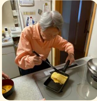
玉子焼き 上手にひっくり返してますよ