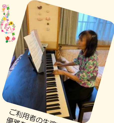
ご利用者の生演奏で 優雅な時が流れます