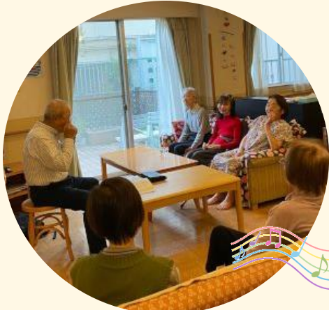
ハーモニカに合わせて歌声が響きます