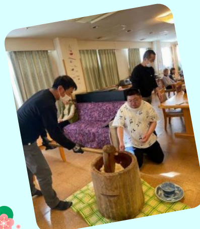
おともちビッコもペタンペタン!!