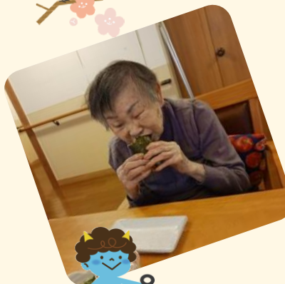
節分です! 鬼がやってきました。「鬼は外、福は内」 恵方巻をガブリ!