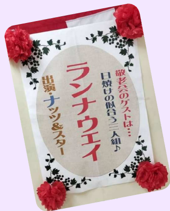
舞台裏（只今準備中）