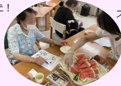
美味しそうなスイカを選んでもらいました。