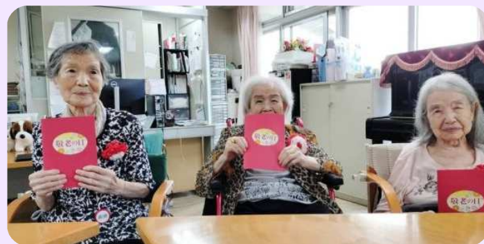
ご長寿の3名。3人合わせて295歳です！ 一番のご長寿 102歳のS様から「私はあと10年生きますよ！」との一言に元気を頂きました！