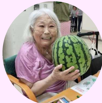
8kg 超える大きなスイカを丸ごと抱えて重さにびっくり！