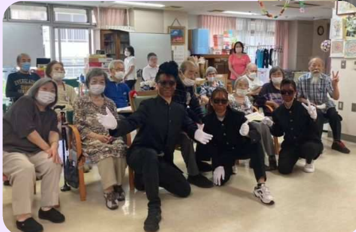
最後はみんなで記念撮影を。 「はい、ポーズ！」