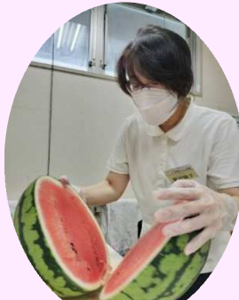
切るのも大変！ 真っ赤なスイカに「おいしそう！」との声が上がりました。