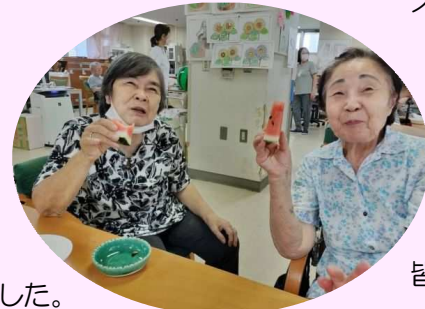
スイカを片手に「ハイチーズ」