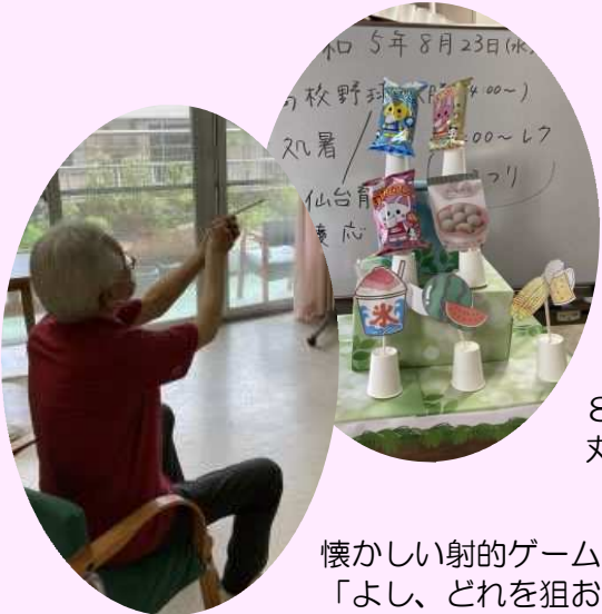
懐かしい射的ゲーム 「よし、どれを狙おうかな…!？」