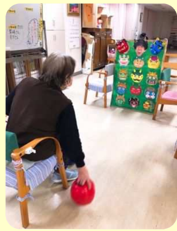
ボーリングのような玉を投 げて鬼の顔のボードを倒す ゲームを楽しみました

裁縫が得意なKさんが 棒人形リンダ&ひろ子の 節分用ダンスの衣装を 作ってくれました