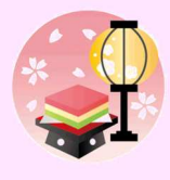
皆さんと 一緒に手作りした 「ひな祭りゲーム」 お雛様の前の台にお 手玉を投げ入れて得 点を競うゲームです。 「よいしょ！！」 「何点入った？」 と盛り上がりました。