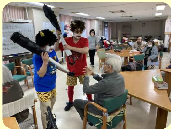
赤鬼と青鬼が登場！「鬼は外！福は内！」 お手玉投げて鬼を撃退！！