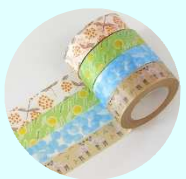
マスキングテープは 何にでも貼れて、はがしても跡が残らないし、テープの上 に文字も書けるので便利です。 様々な色や柄があり 100円ショップでも購入できます。 メモやラベル、飾りつけやラッピングなど楽しく活用でき るのでおすすめです！