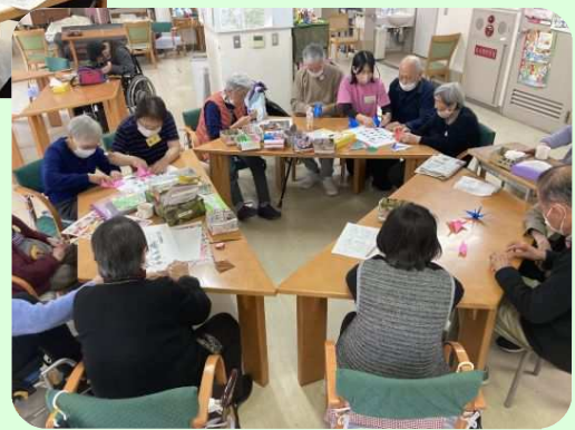
皆さんの力でたくさんの鶴が出来上がり 色とりどりのとても素敵な 千羽鶴になりました！