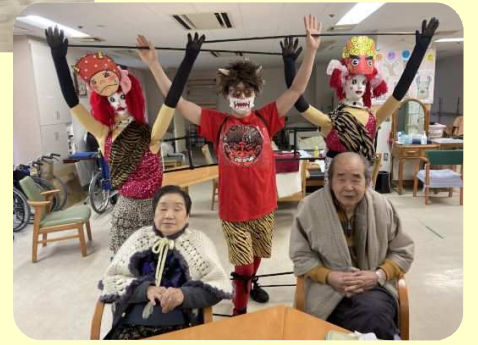
最後は年男のご利用者さん と記念撮影を。