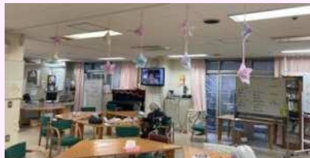
フロアに吊り下げました。ゆらゆらと揺れてとても可愛らしかったです!