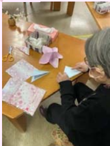
折り紙で三角を3つ作る

桜の飾りを作りました! 両面桜柄の折り紙を折って、切って、つなげるだけ! 簡単なのに、出来上がりはとてもきれいです。天井から吊り下げると春の心地よい風にひらひらと揺れ、室内でも桜を楽しみました。