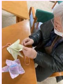
糸でつないで出来上がり!