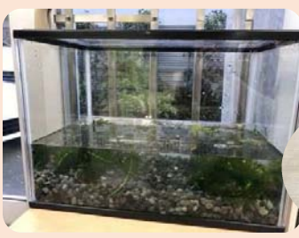
←1階にお嫁に来たメダカたち