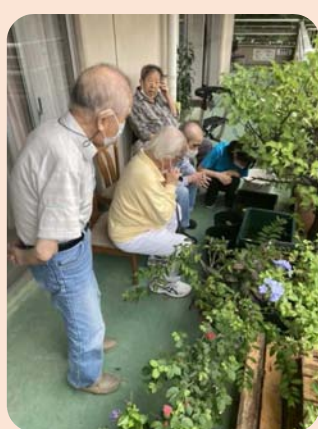
2階のベランダにはメダカがいっぱい!

また、10月頃にY様から白いメダカを頂き、仲間入りしました! 白いメダカはきれいで、黒い水槽を泳ぐ姿はとても優美です。またまた楽しみが増えました! これからはシルバーのメダカも仲間入りをする予定です! ? メダカが欲しい方がいましたら、ぜひデイサロンこまばへご連絡ください! 可愛いメダカをお分けします。一緒にメダカを飼いましょう☆