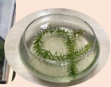
←その赤ちゃんはこの中で育てます