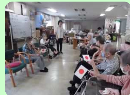
日の丸の応援の中、入場行進