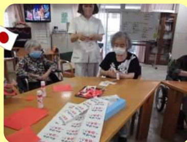
『がんばれ日本』の文字を貼りつけて