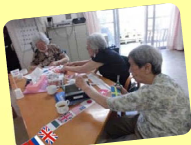
「これはなんて国かしらね？」 「何だろうね〜？」と 見たことない国旗に興味津々です