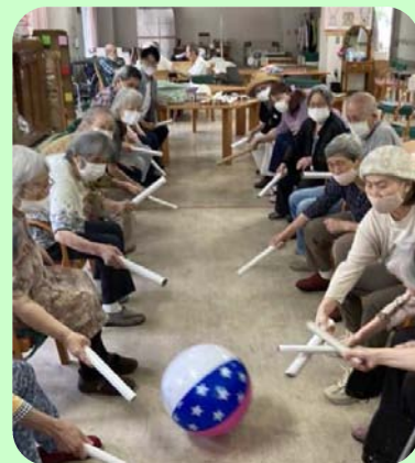
駒オリンピック「ホッケー大会」で大フィーバー！