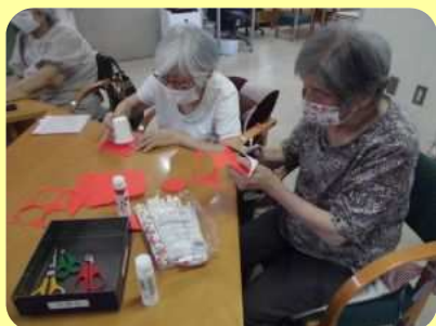
作業分担して『日の丸』作成中です