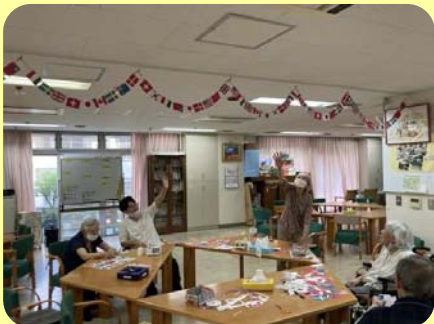
色々な国旗をつなげてフロアに飾り付けました

8月24日のブルーインパルス記念展示飛行は屋上から見学。当日は曇り空でしたが、真上を2回も通って最後には見事に5色のラインを描いて行きました！