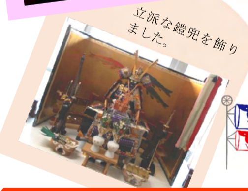
立派な鎧兜を飾りました。

「かぶと」「花菖蒲」「金太郎と登り鯉」のぬり絵を水彩画や色鉛筆で作りました! 少し難しいぬり絵でしたがみなさん一生懸命仕上げてくださいました。