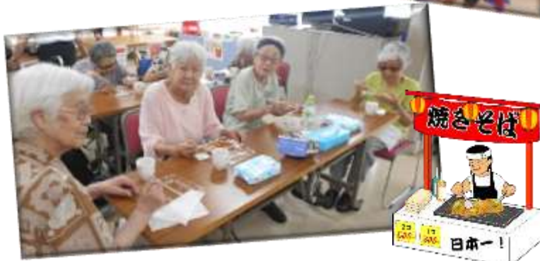
模擬店では焼きそば・フランク・ソフトクリーム・チョコフォンデュなどたくさん召し上がって頂きました。