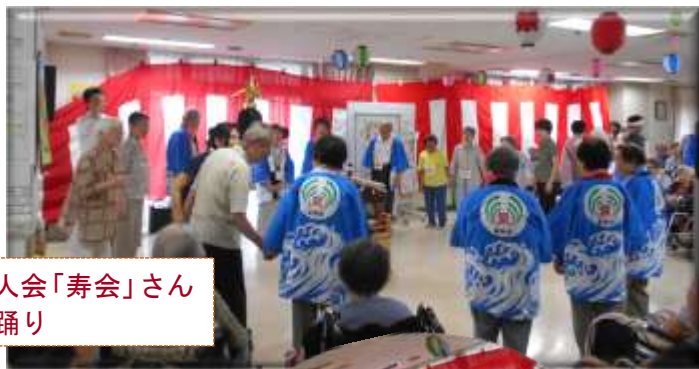
地元の老人会「寿会」さんによる盆踊り